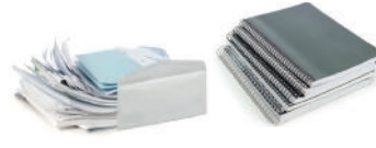
Courriers, enveloppes et autres papiers