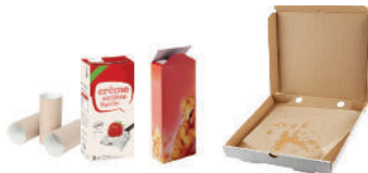
Emballages en papier et carton