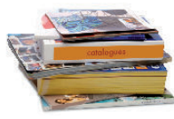
Prospectus et catalogues