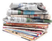
Journaux et magazines