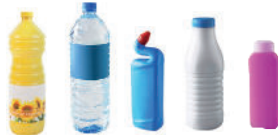
Emballages en plastique